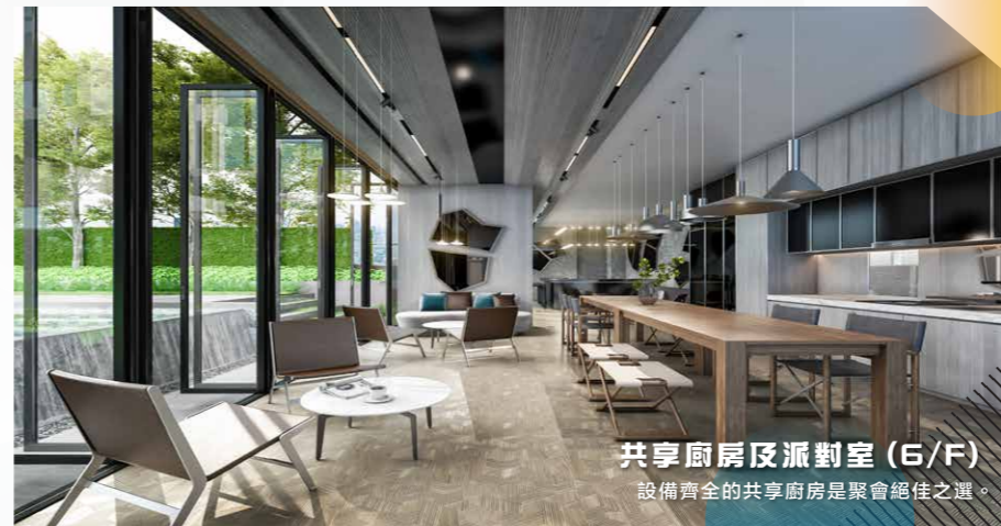
共享廚房及派對室 (6/F)