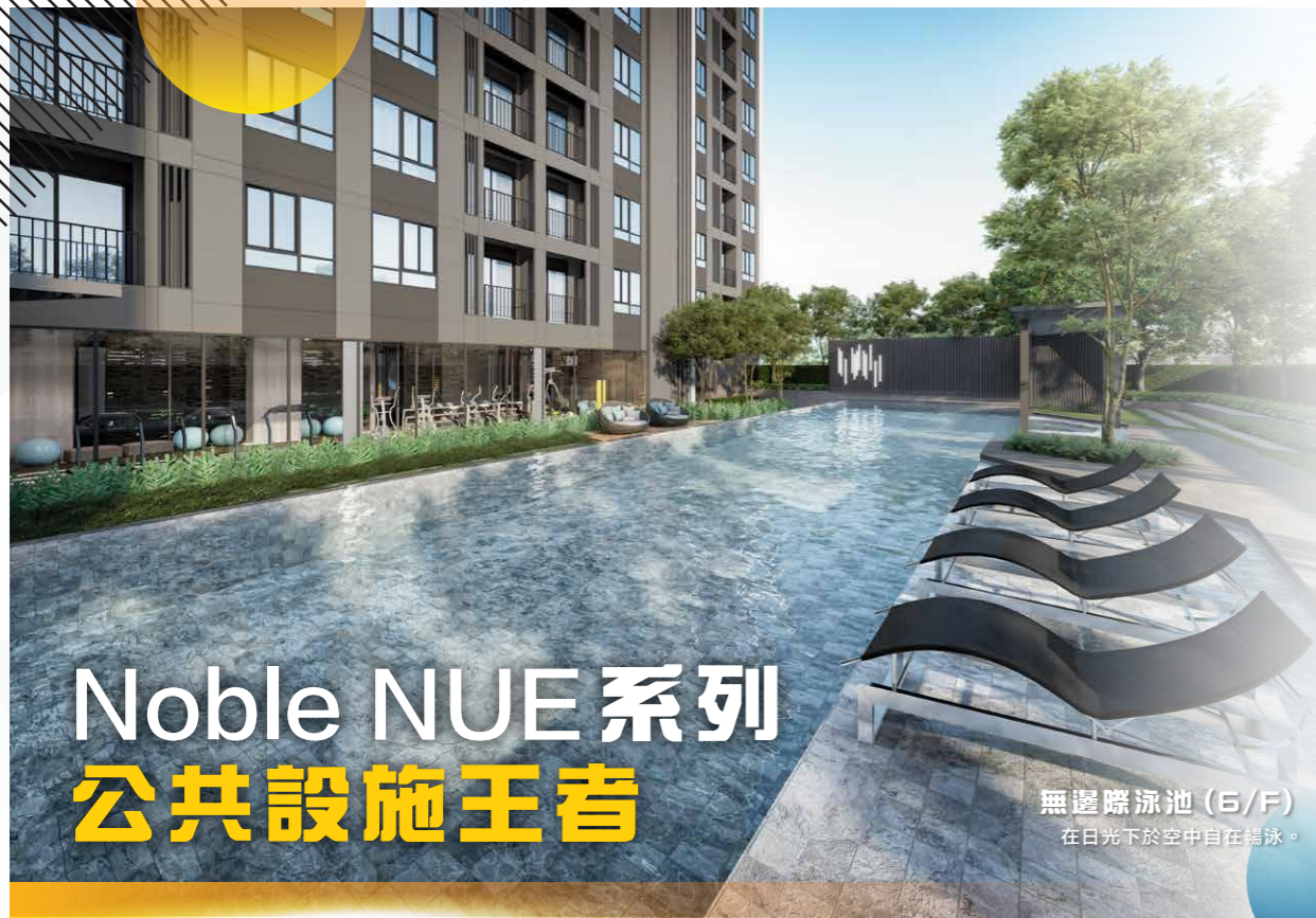
無邊際泳池 (6/F) 在日光下於空中自在暢泳。