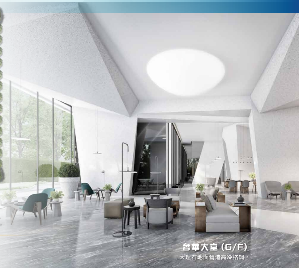
奢華大堂 (G/F) 大理石地面營造高冷格調。